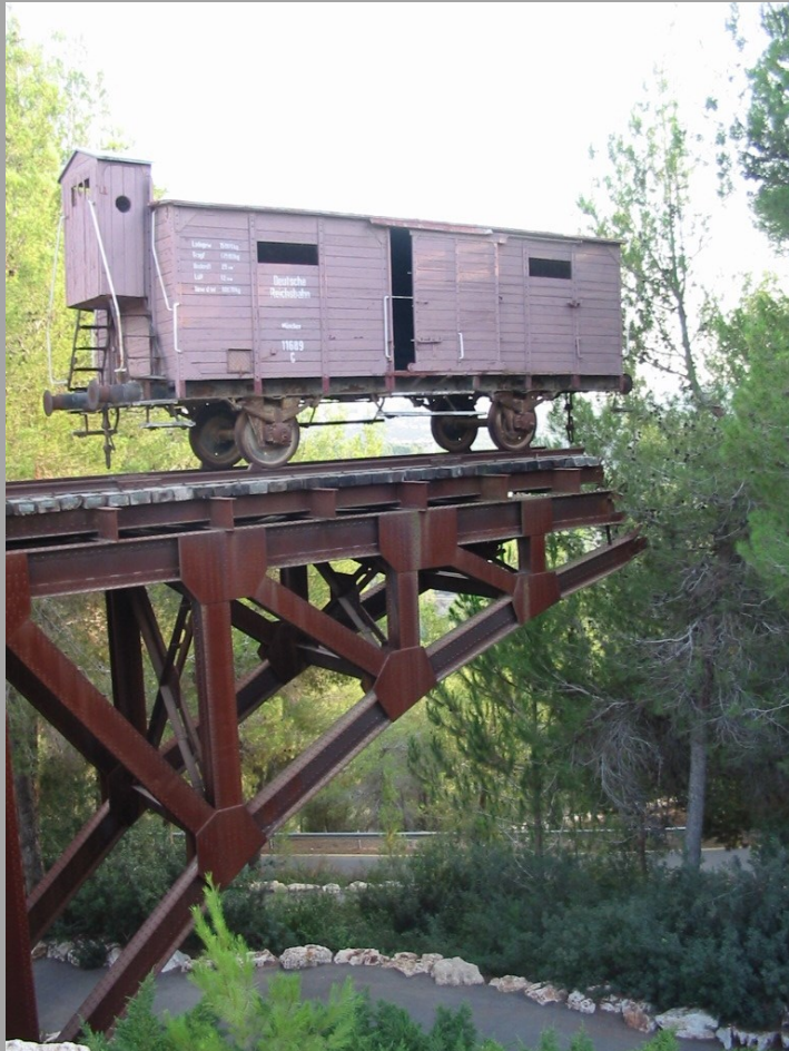
Denkmal zur Erinnerung an die Deportationen auf dem Weg zum Tal der Gemeinden in Yad VaSchem