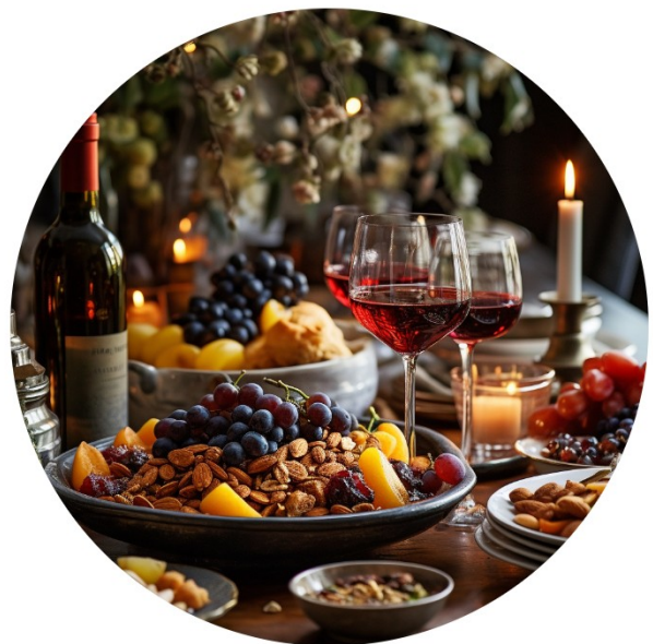
Tu BiSchwat Seder

Tu bi-schat-Lied „Der Mandelbaum erblüht“